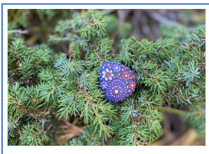
Porte-bonheur Lucky Charm