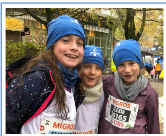
Course de l'Escalade à Genève The Escalade Race in Geneva