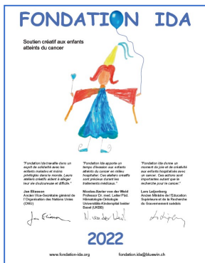
Calendrier 2022 Calendar 2022