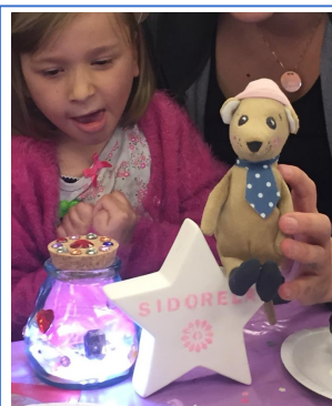
Donation de peluches d'IKEA Donation of stuffed toys from IKEA